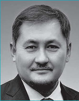
قرائت پیام سیاسات نوربیک وزیر علوم و آموزش عالی جمهوری قزاقستان