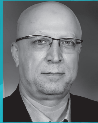
قرائت پیام محمدعلی زلفی گل وزیر علوم، تحقیقات و فناوری جمهوری اسلامی ایران