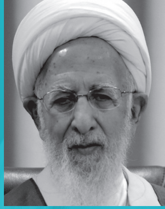
بخش پیام آیت الله استاد عبدالله جوادی آملی

روز اول، چهارشنبه ۱۰ اسفند ۱۴۰۱ ساعت ۸ الی ۹:۳۰